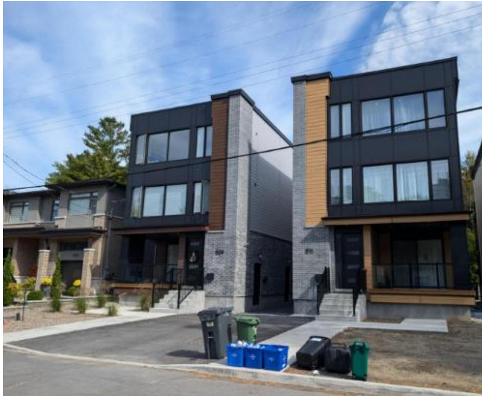
609 & 611, chemin Parkview Road