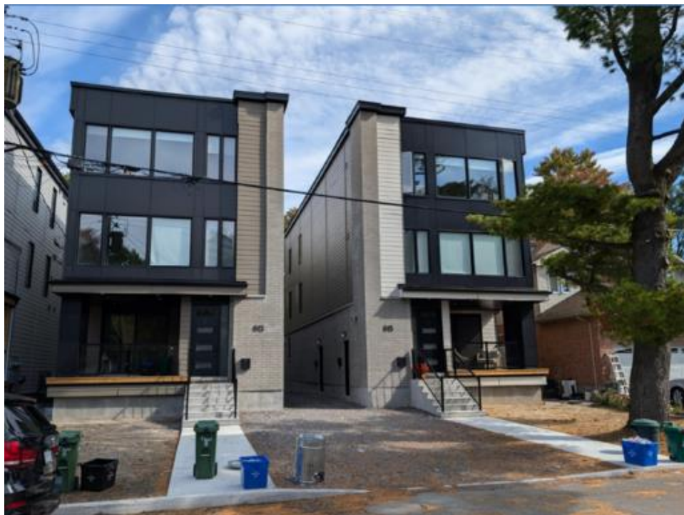
613 & 615, chemin Parkview Road