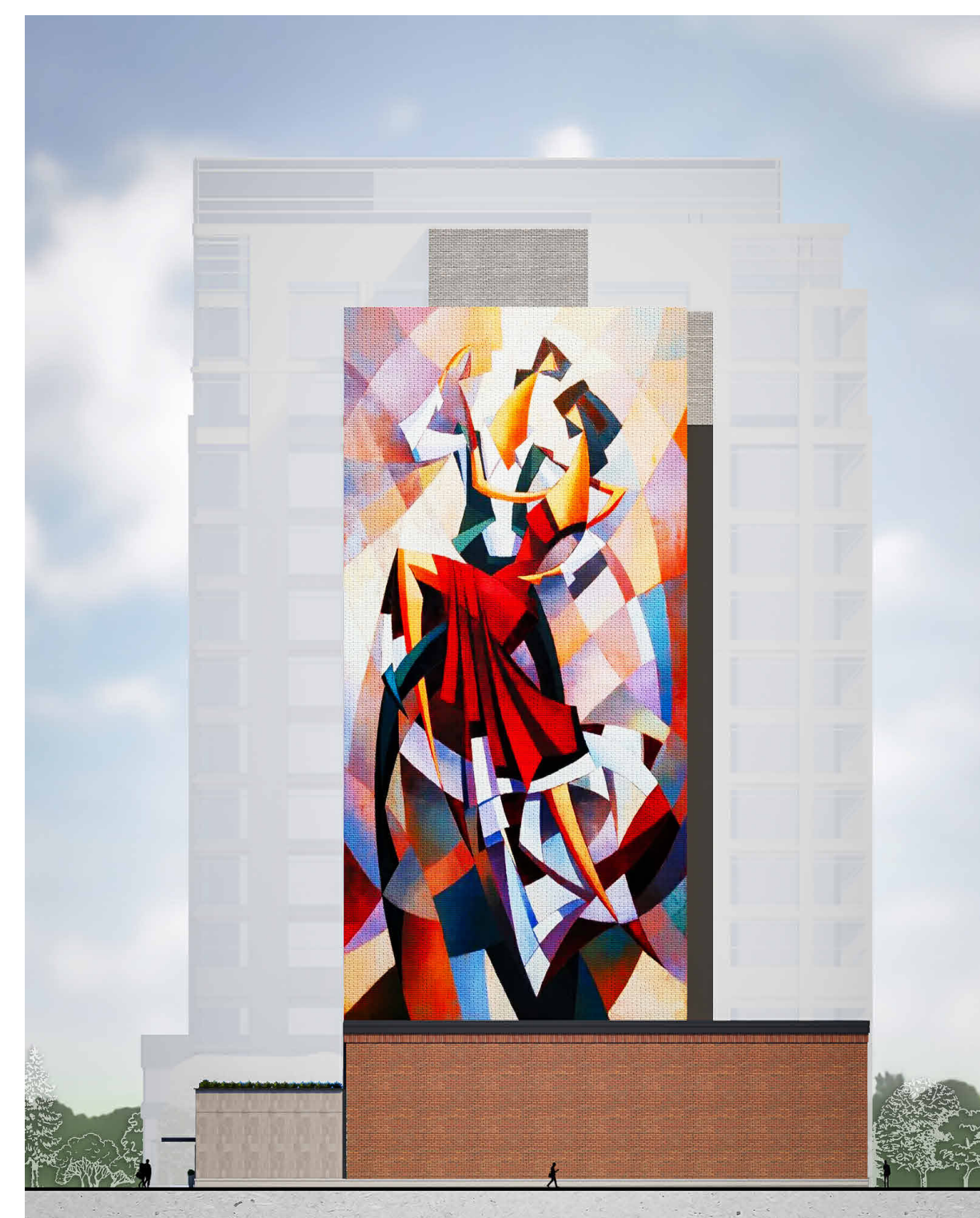
COLOURED ELEVATION - SIDE FACADE (EAST)