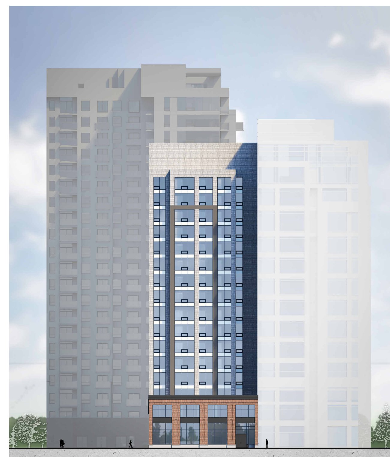
COLOURED ELEVATION - YORK STREET (NORTH)