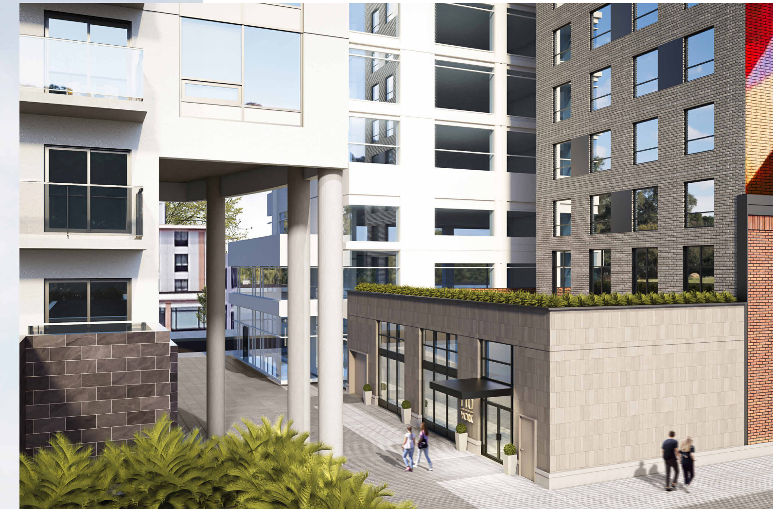
PERSPECTIVE - BACK FACADE (SOUTH)