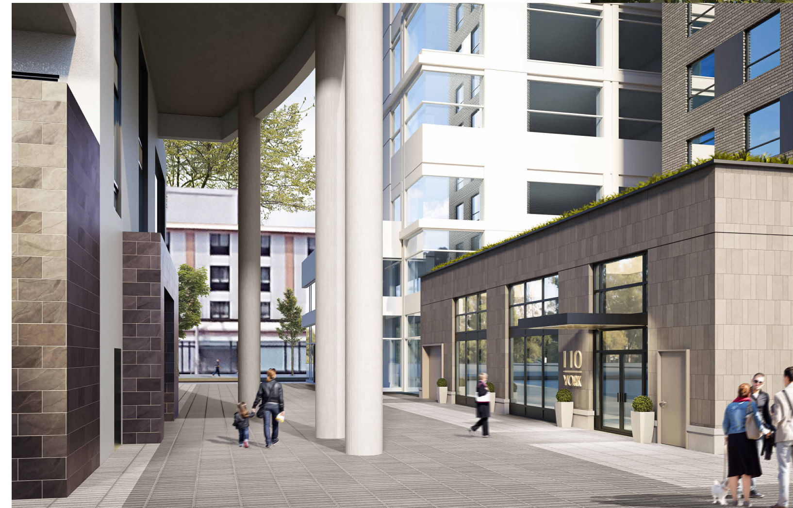
PERSPECTIVE - BACK FACADE (SOUTH)