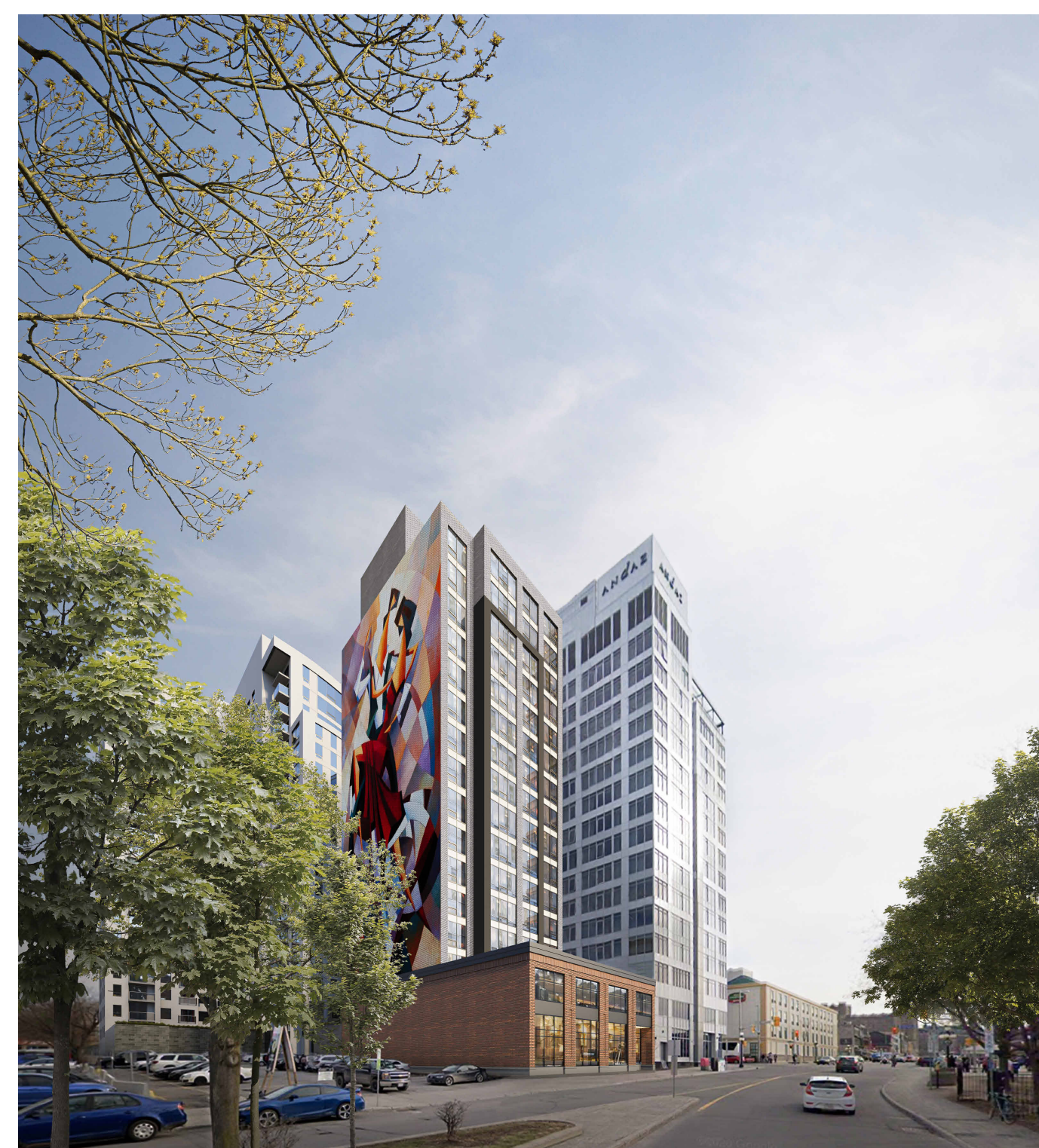
PERSPECTIVE - YORK STREET (NORTH-EAST)