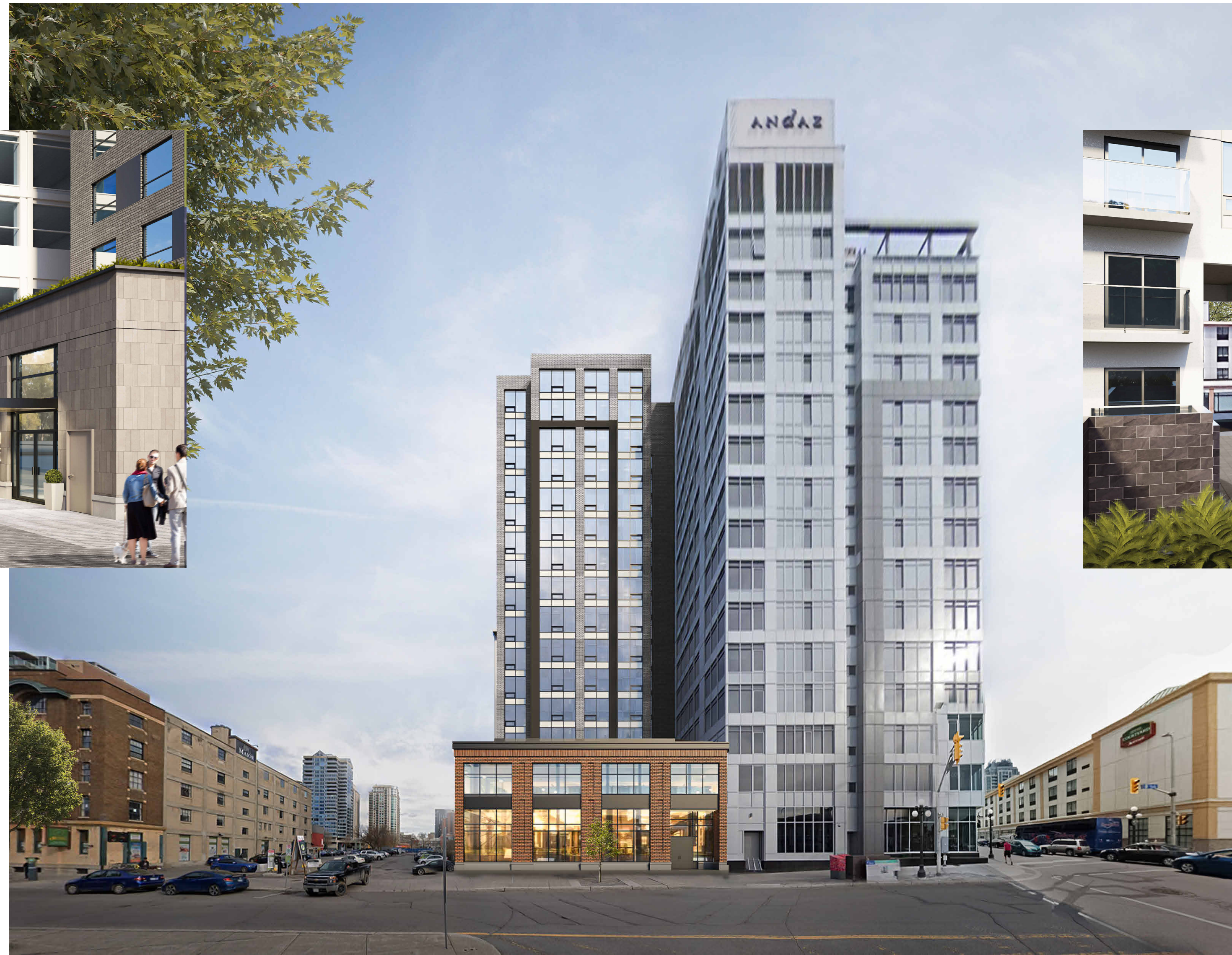
PERSPECTIVE - YORK STREET (NORTH)