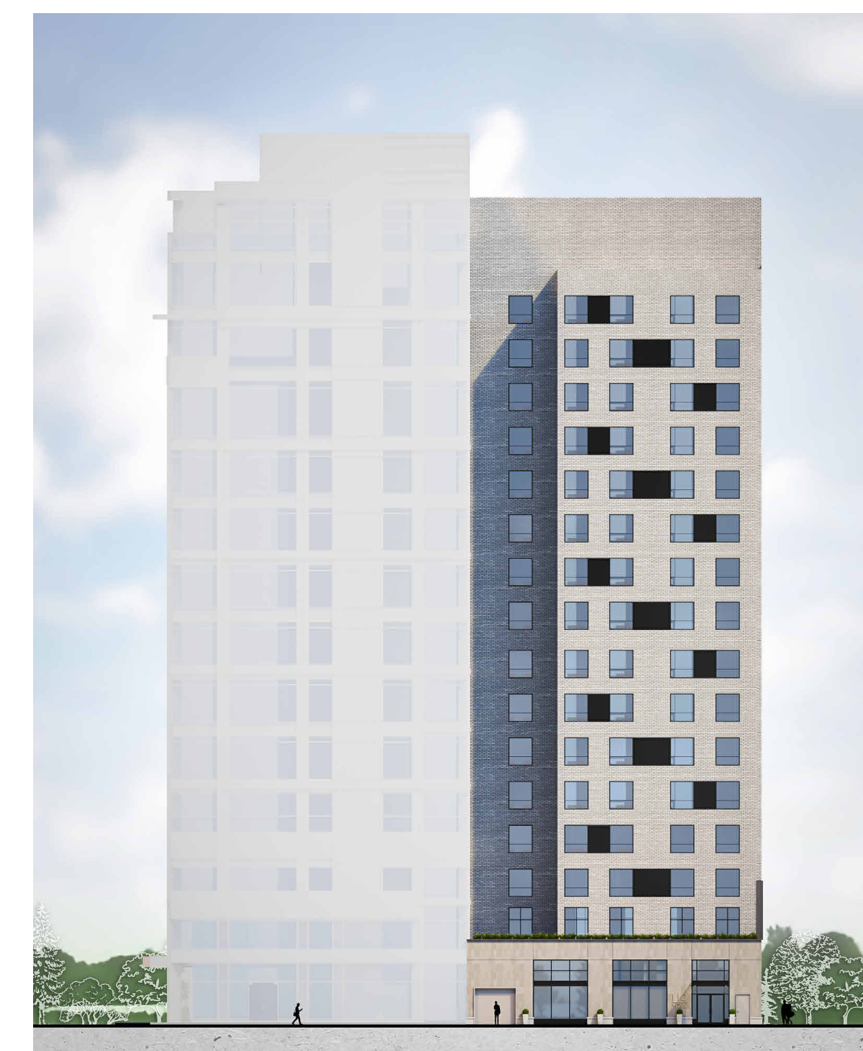
COLOURED ELEVATION - REAR FACADE (SOUTH)

C:\Fichiers Revit\Local\YORKST_13098_ARC_R22_spoanisU643X.rvt