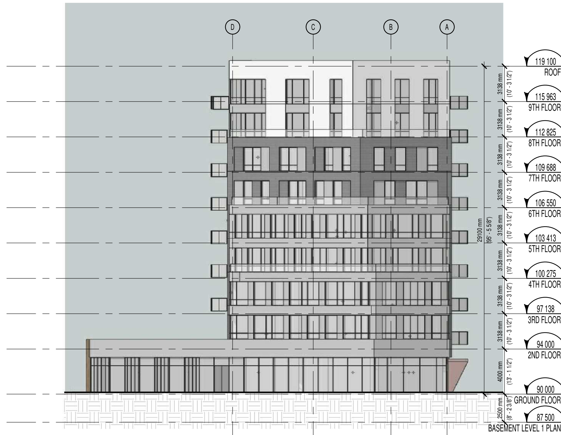
EAST ELEVATION 1:200