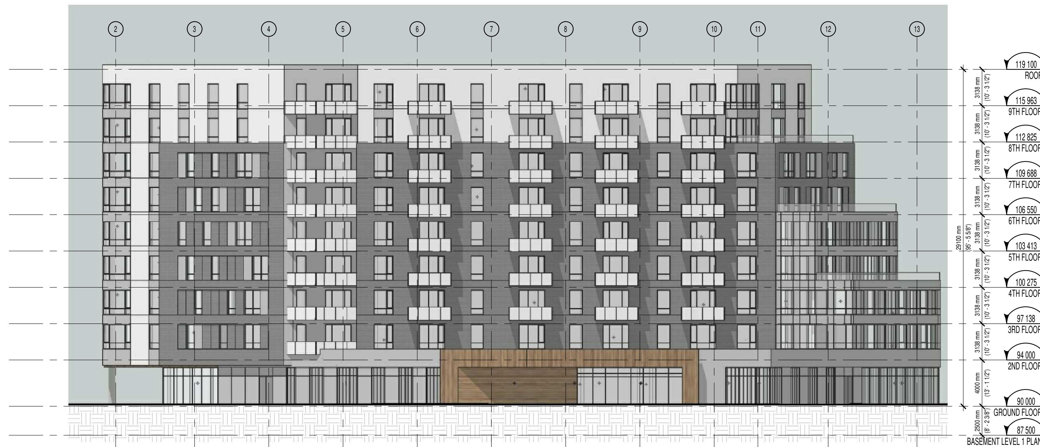
SOUTH ELEVATION 1:200