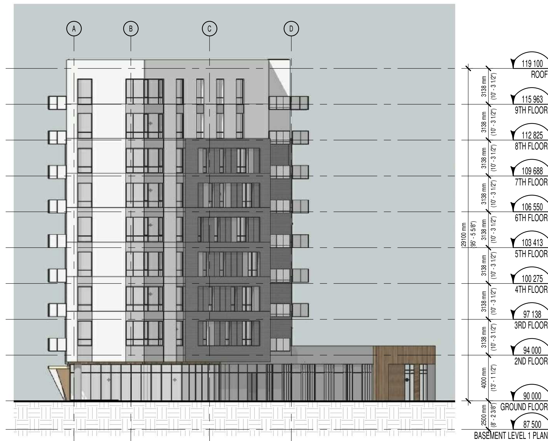
WEST ELEVATION 1:200