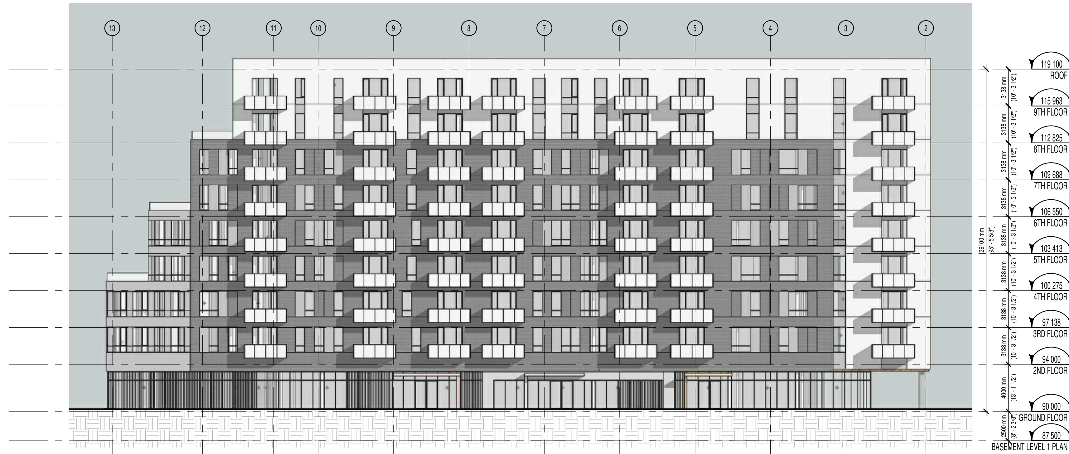
NORTH ELEVATION 1:200