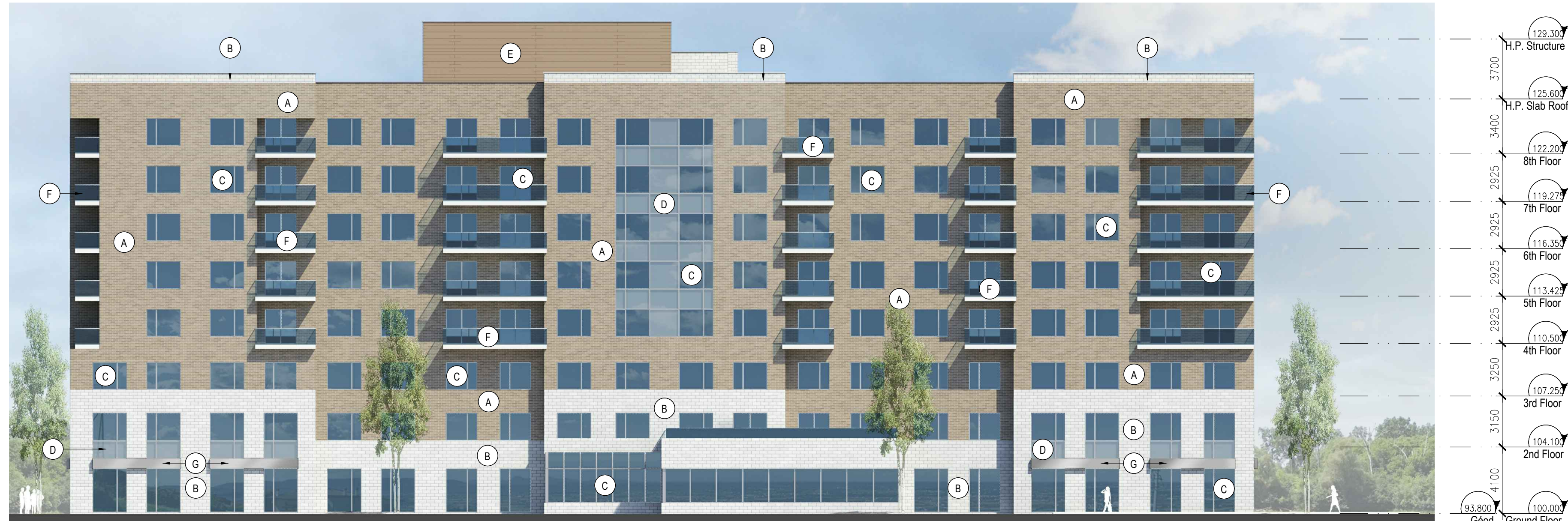
SOUTH ELEVATION 1:200