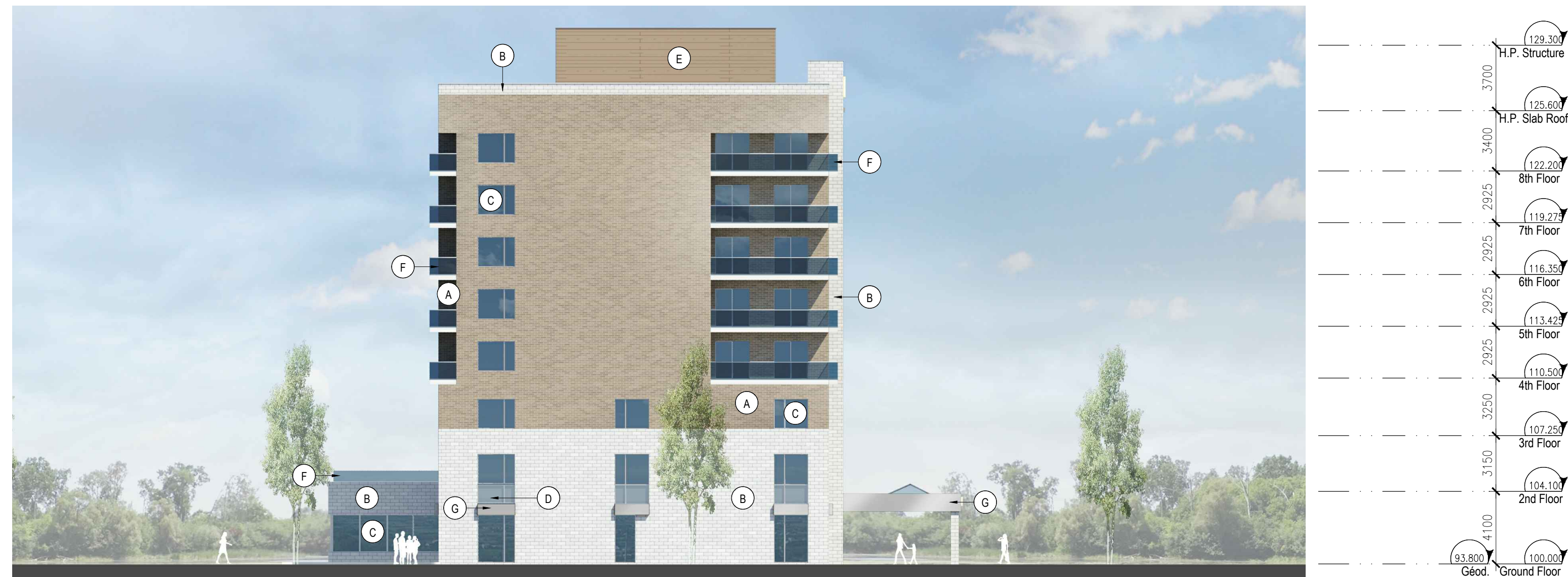
EAST ELEVATION 1:200