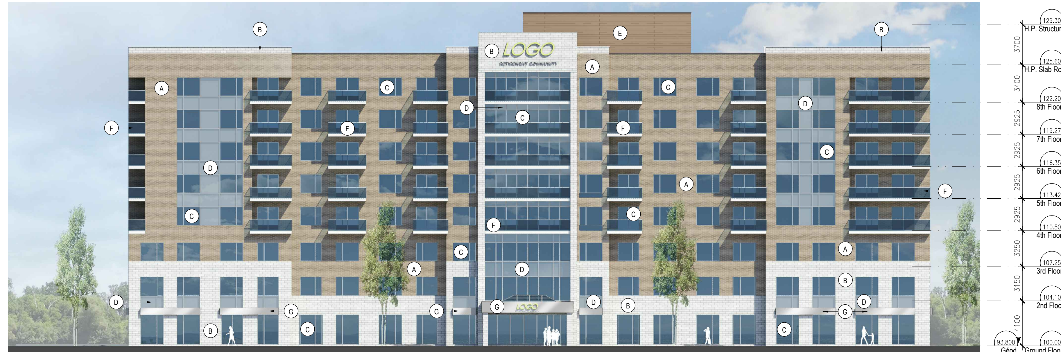
NORTH ELEVATION 1:200