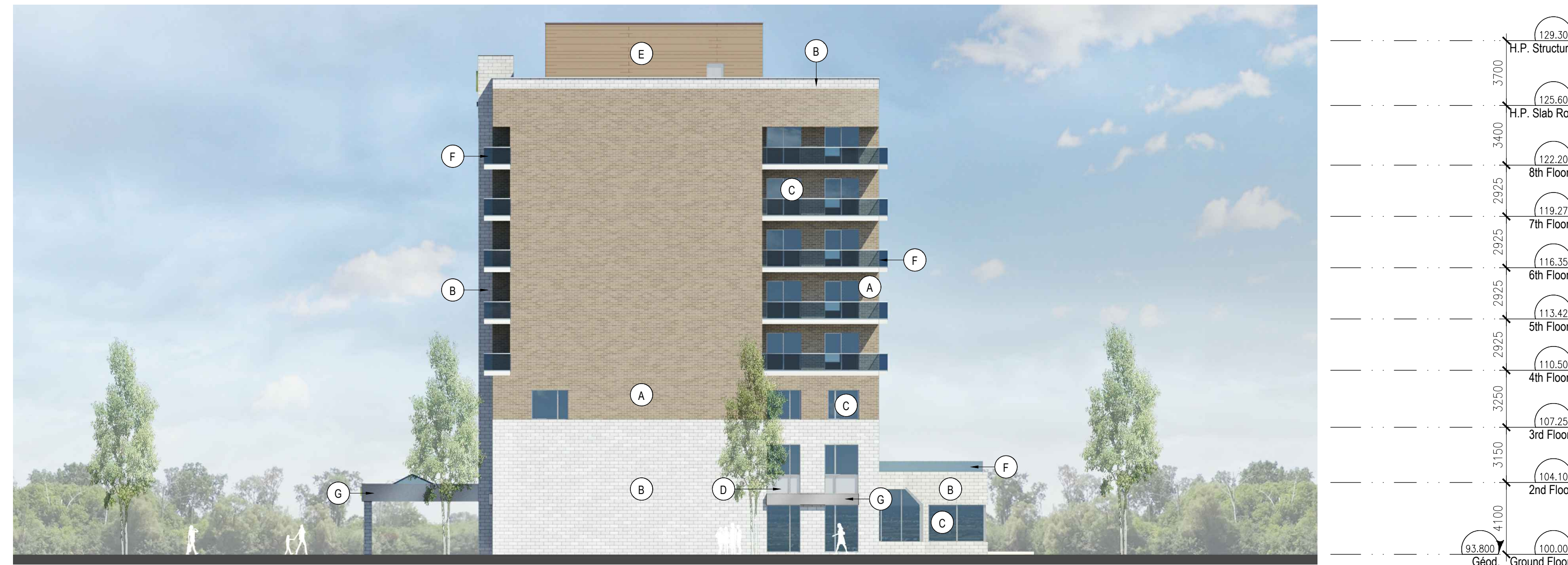
WEST ELEVATION 1:200