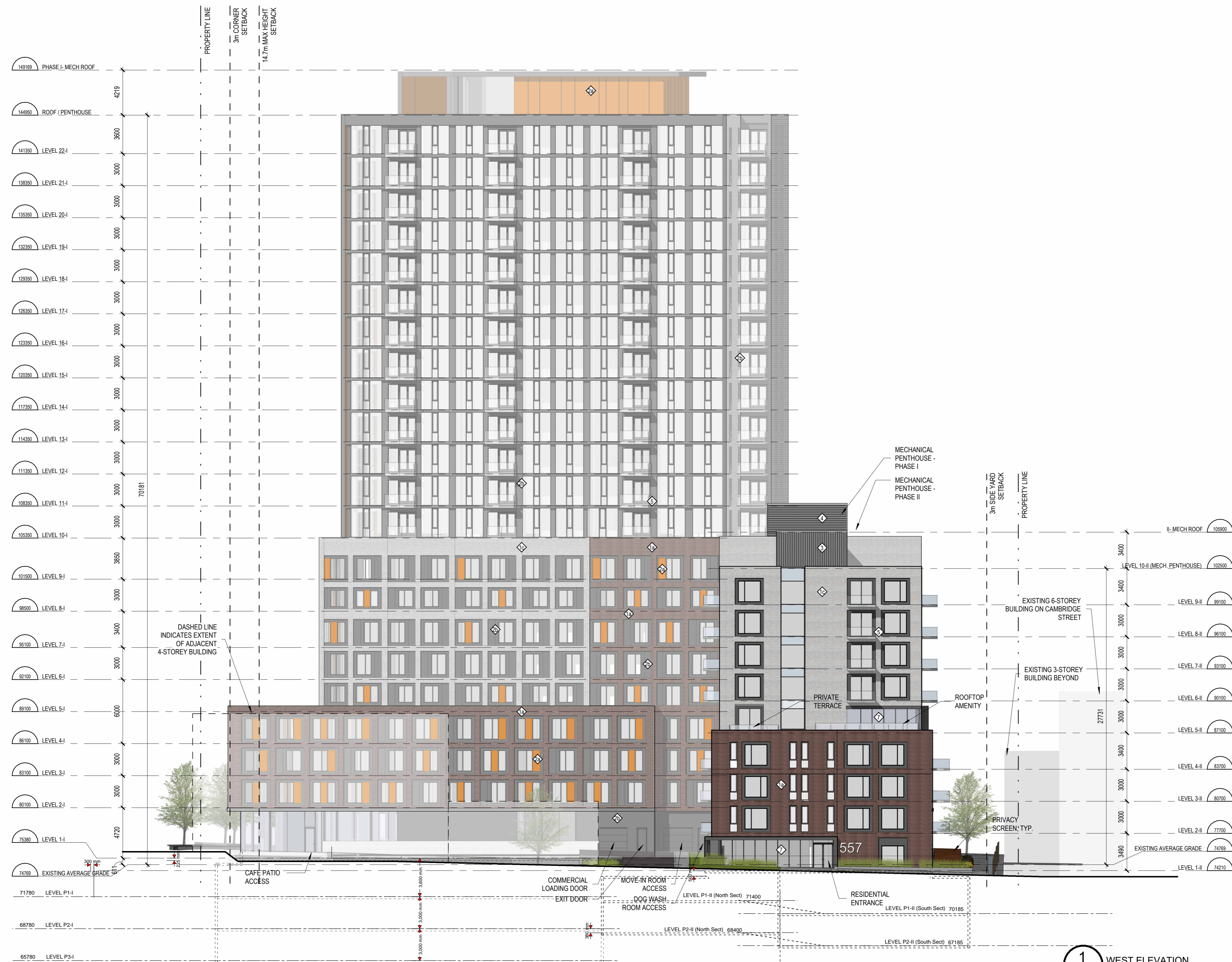
1 WEST ELEVATION A.202 1:200