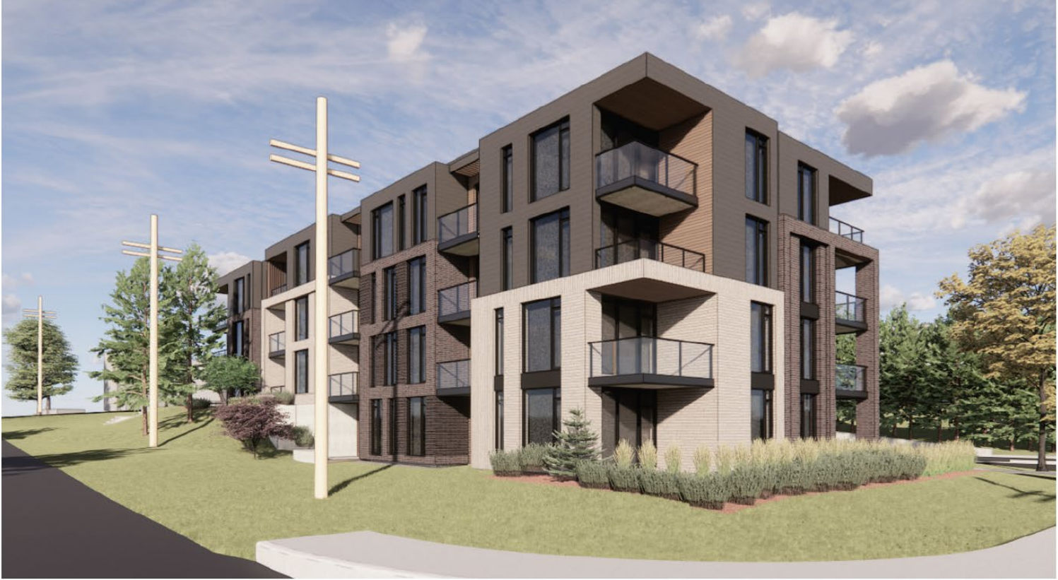
1185 BEAVERWOOD ROAD VIEW LOOKING WEST AT BEAVERWOOD ROAD & SCHARFIELD ROAD | 2119 | SCALE N.T.S.

Project1 Studio Incorporated | mail@project1studio.ca | project1studio.ca