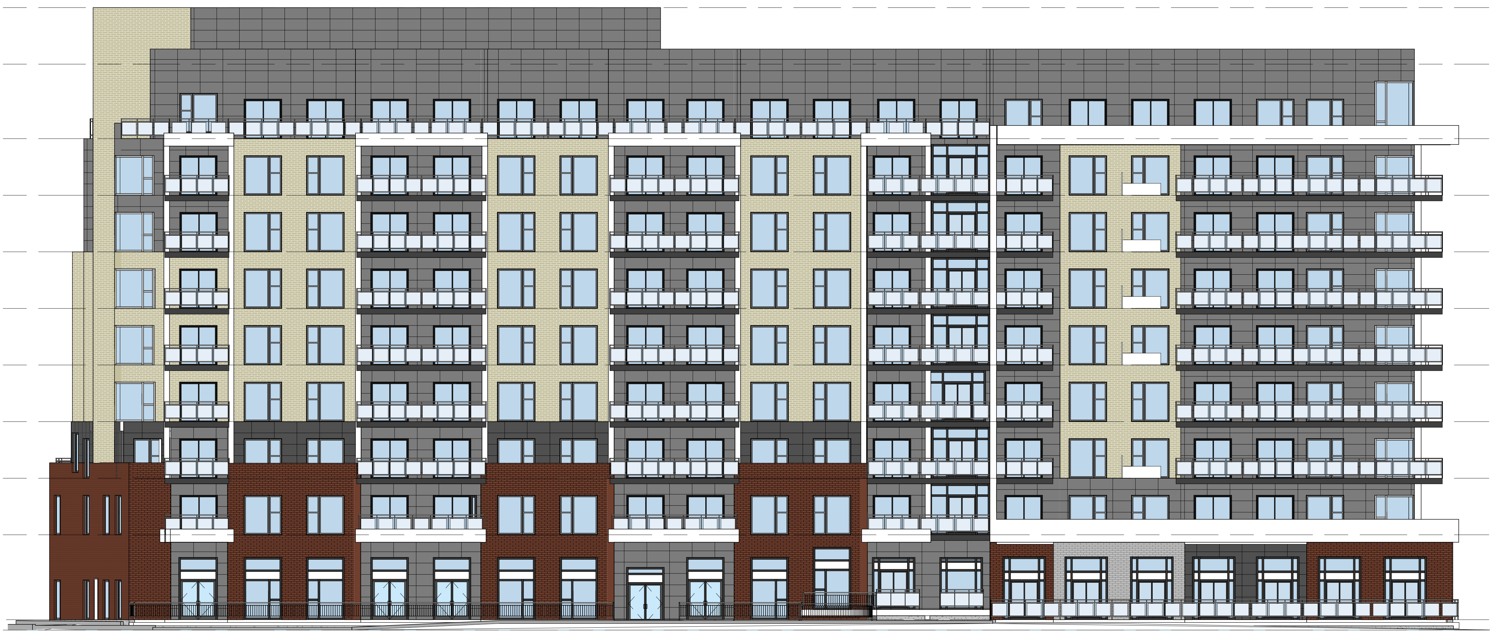
2 WEST ELEVATION A301 1 : 125