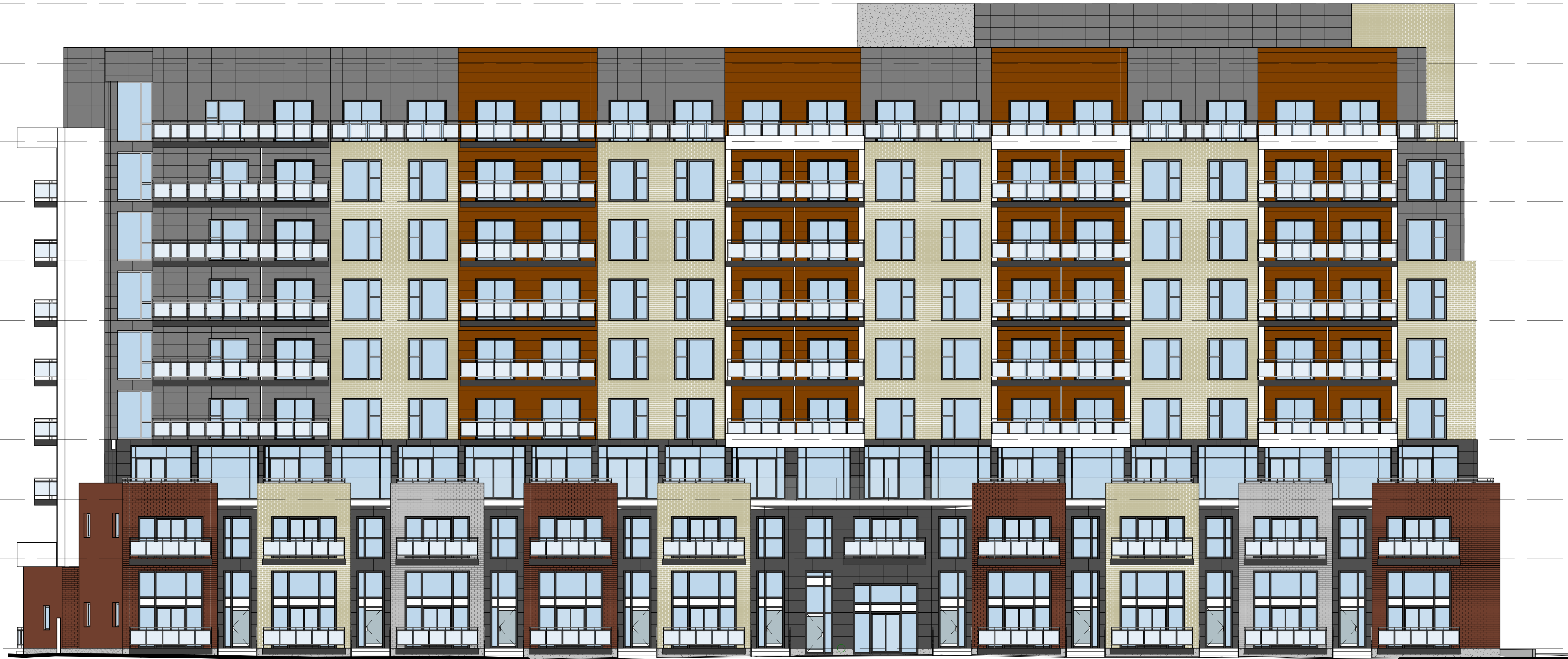
1 EAST ELEVATION A301 1 : 125