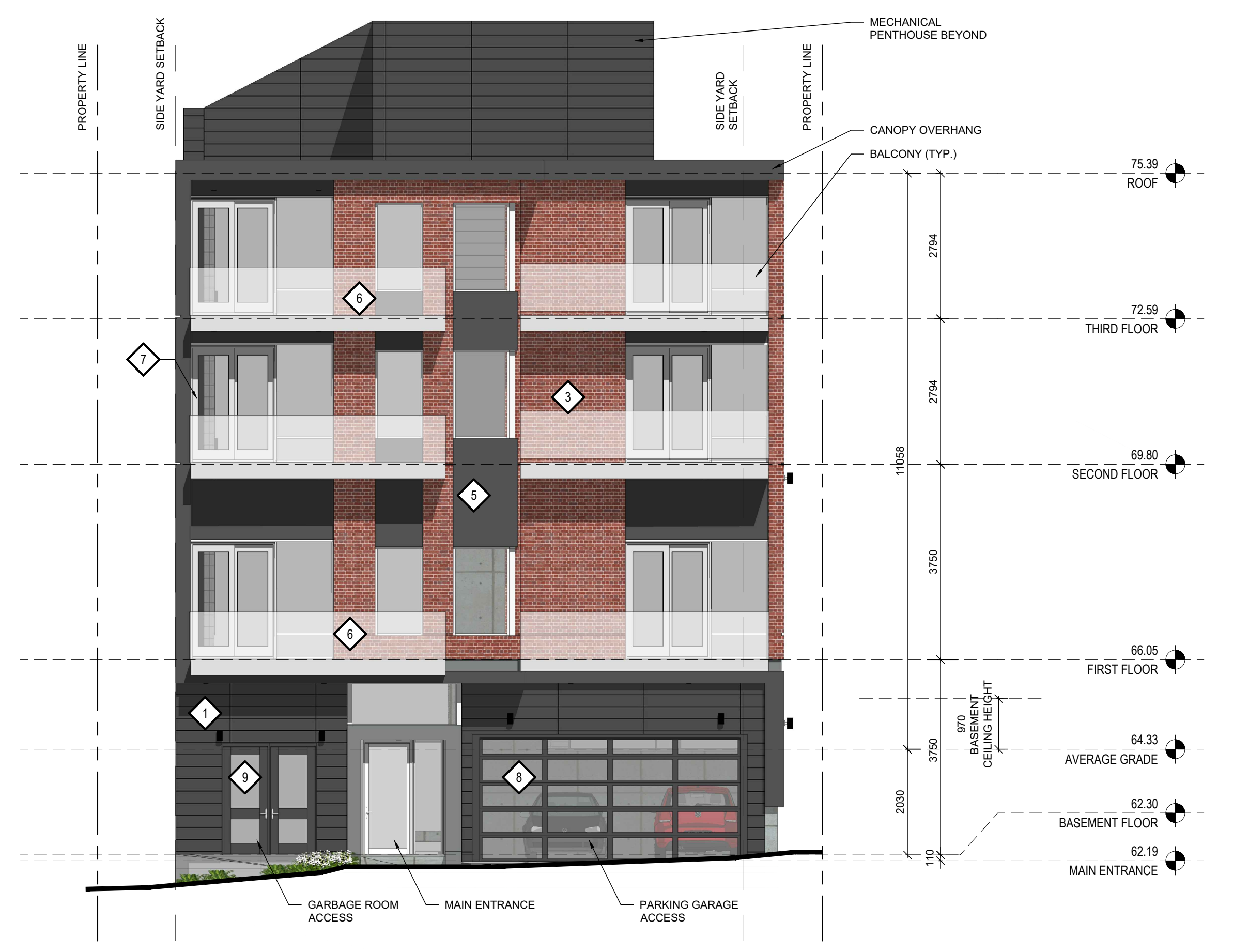
1 EAST ELEVATION A-200 1:75