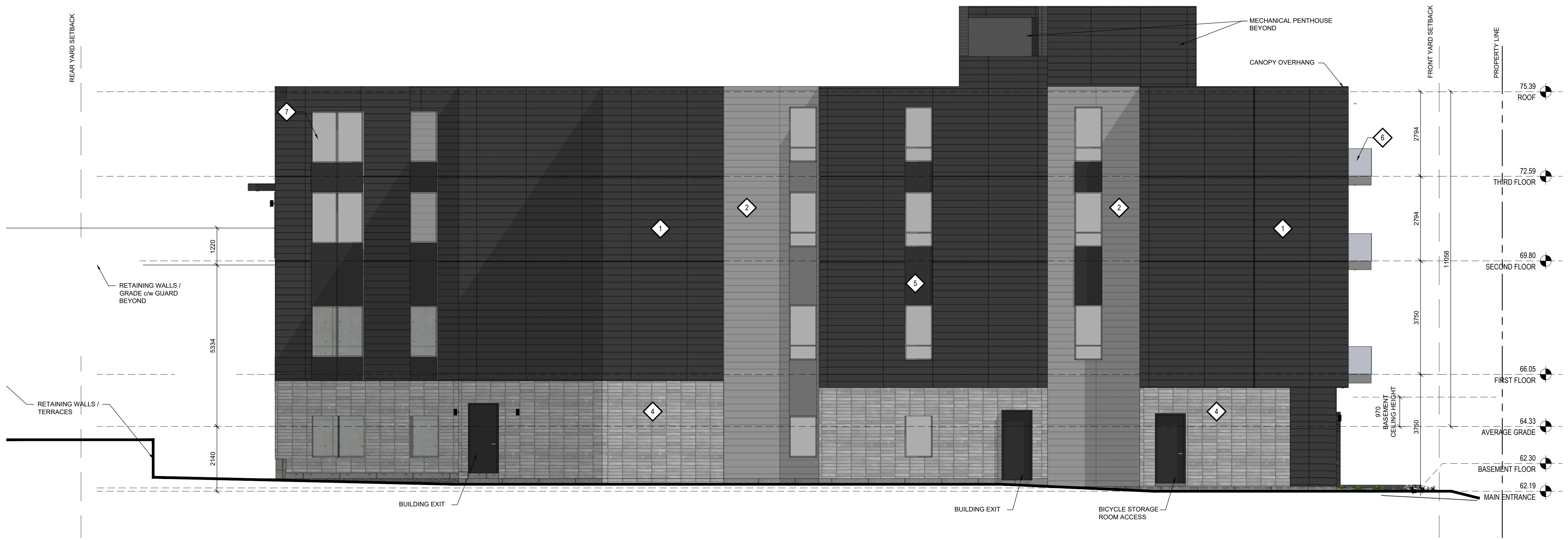
2 SOUTH ELEVATION A-200 1:75