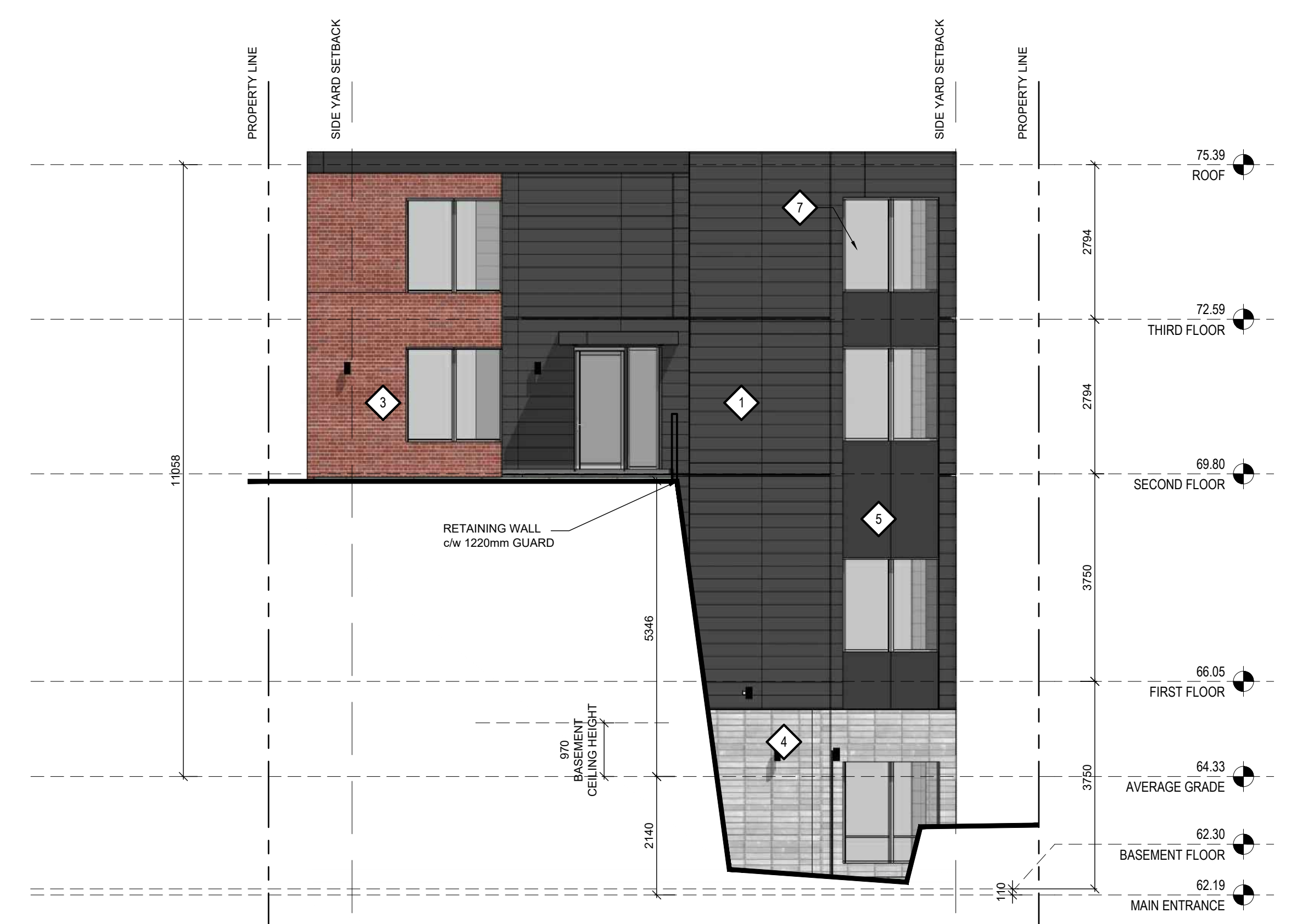
1 WEST ELEVATION A-201 1:75