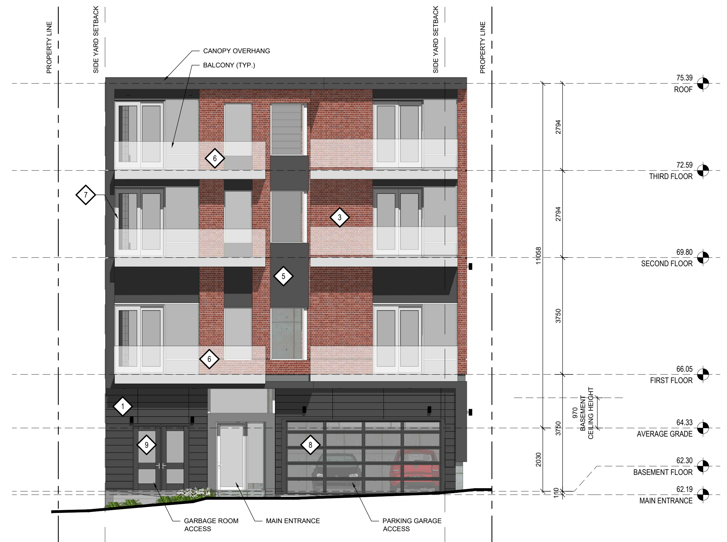
1 EAST ELEVATION A-200 1:75