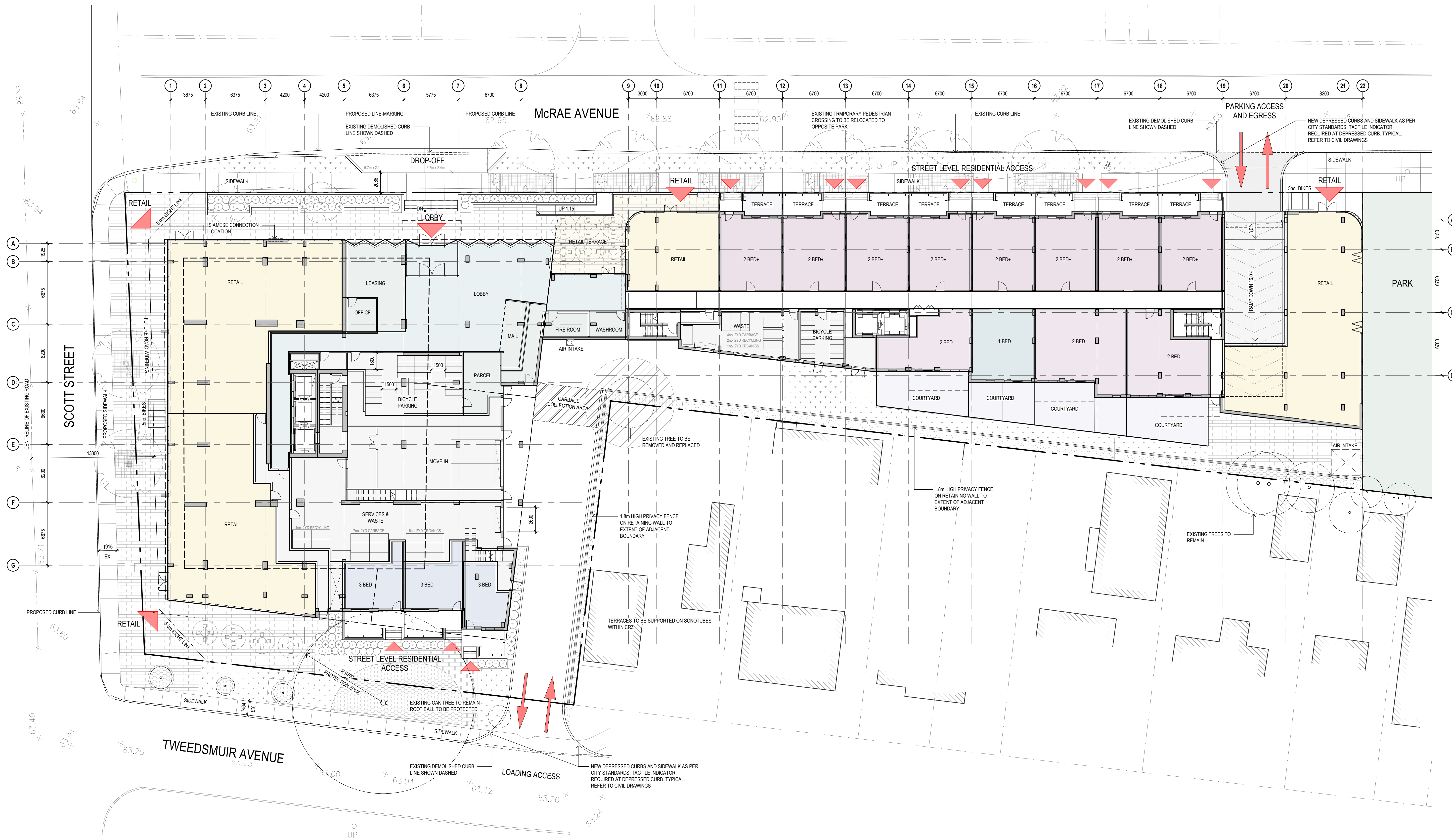
FLOOR PLAN - GROUND LEVEL 1:200

NOTES GÉNÉRALES / General Notes Ces documents d'architecture sont la propriété exclusive de NEUF architect(e)s et ne peuvent être utilisés, reproduits ou copiés sans autorisation écrite préalable. / These architectural documents are the exclusive property of NEUF architect(e)s and cannot be used, copied or reproduced without written pre-authorization. Les dimensions apparaissant aux documents doivent être vérifiées par l'entrepreneur avant le début des travaux. / All dimensions appearing on these documents must be verified by the contractor prior to construction. Veuillez aviser l'architecte de toute dimension erronée ou divergences entre ces documents et ceux des autres professionnels. / The architect must be notified of all errors, omissions and discrepancies between these documents and those of the other professionals. Les dimensions sur ces documents doivent être lues et non mesurées. / The dimensions on these documents must be read and not measured.