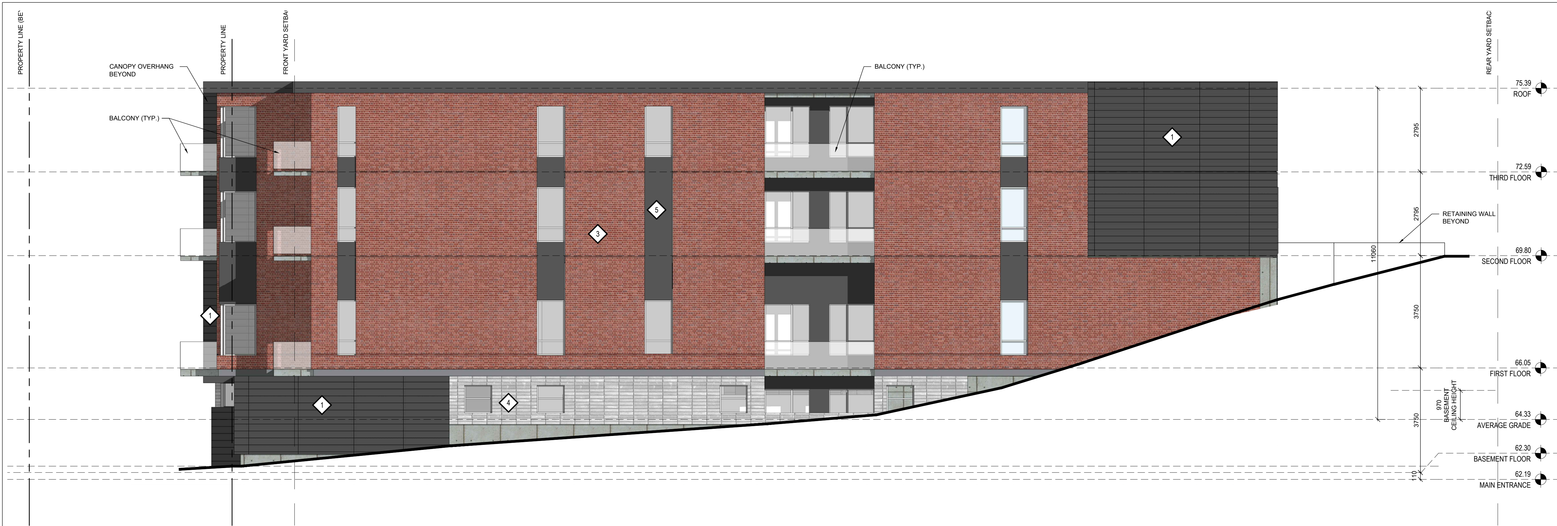
2 NORTH ELEVATION A-201 1:75