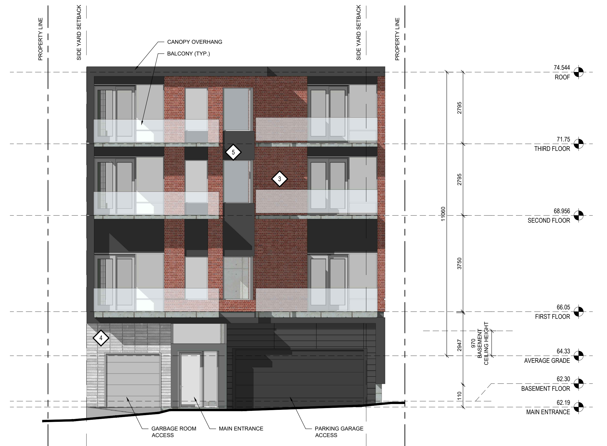
1 EAST ELEVATION A-200 1:75