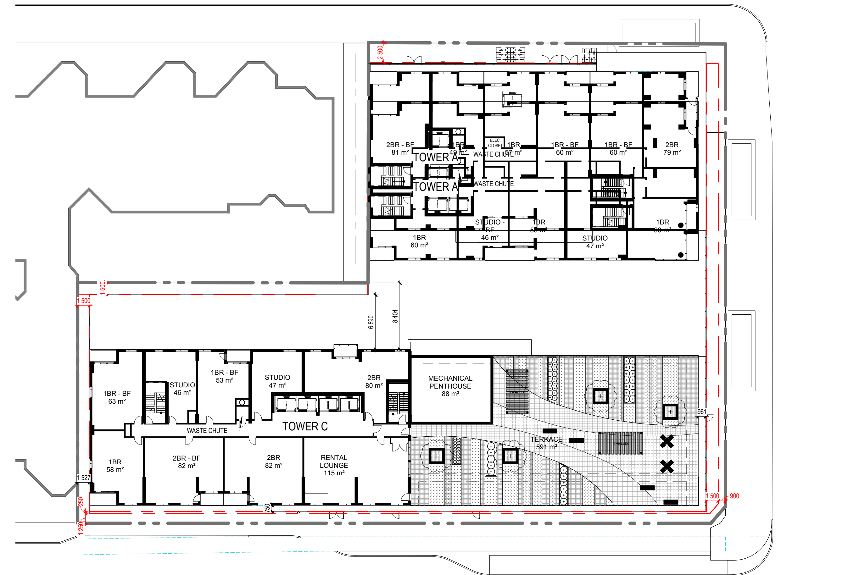
10TH FLOOR - KEY PLAN