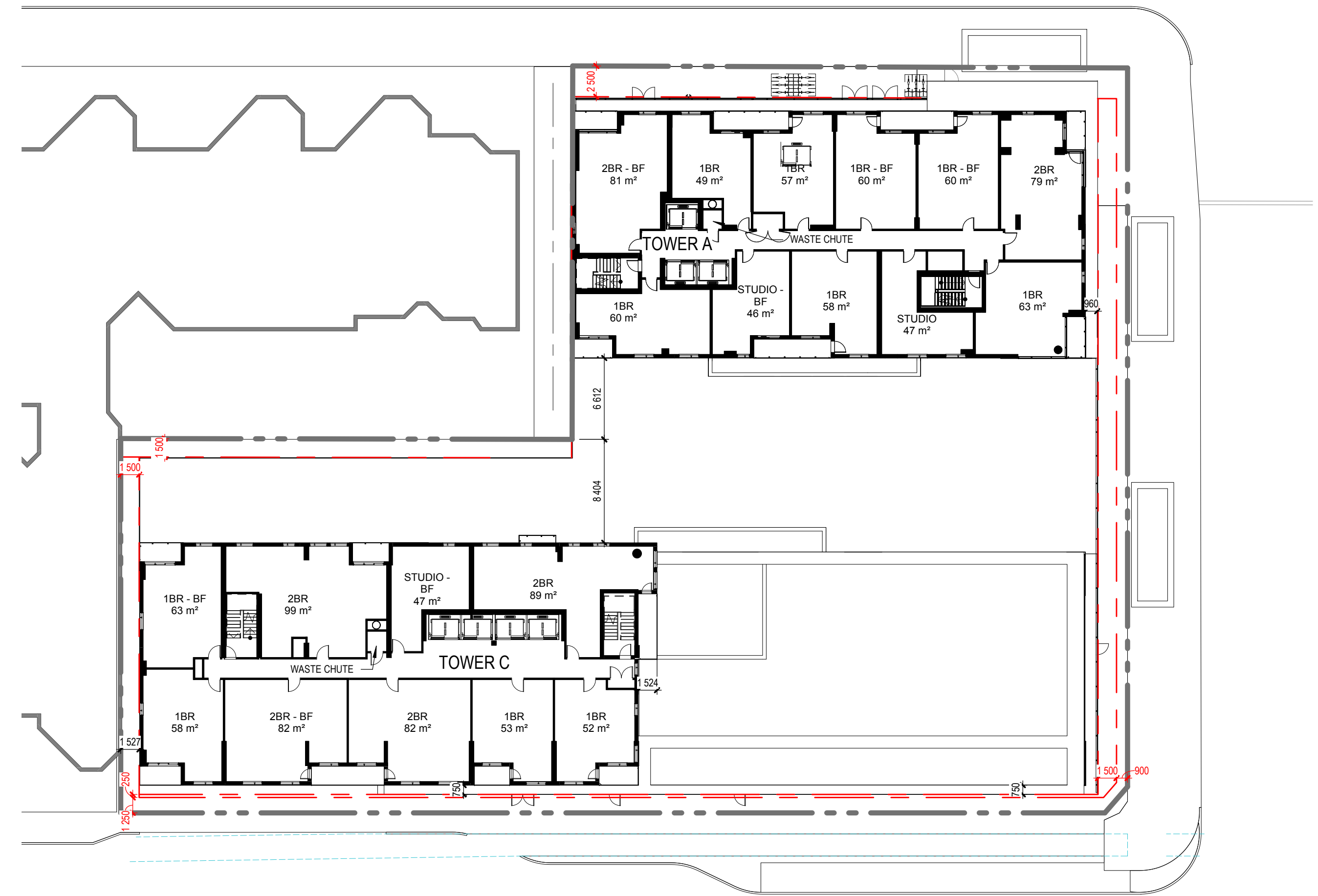
11TH-25TH FLOOR - KEY PLAN