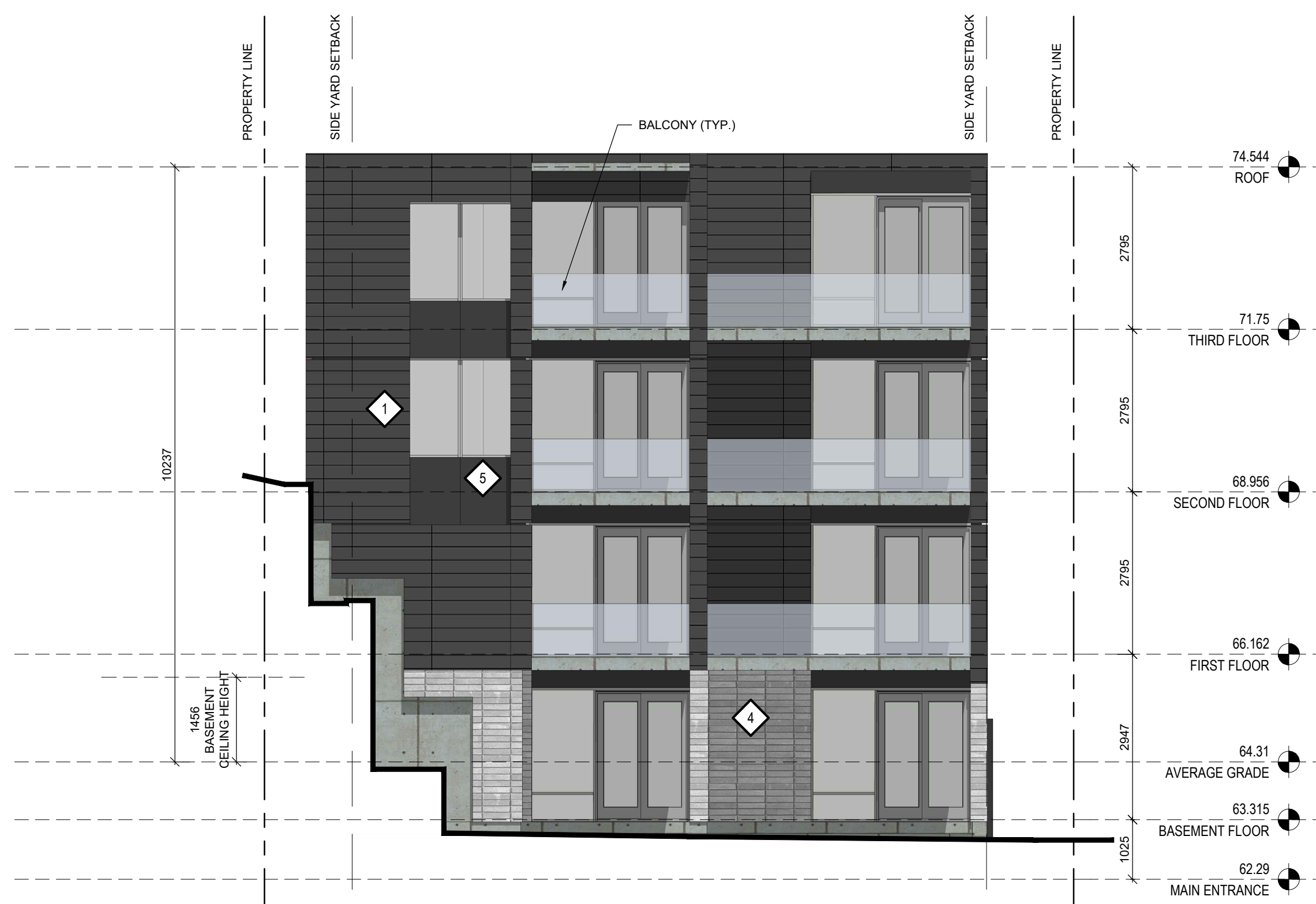
1 WEST ELEVATION A-201 1:75