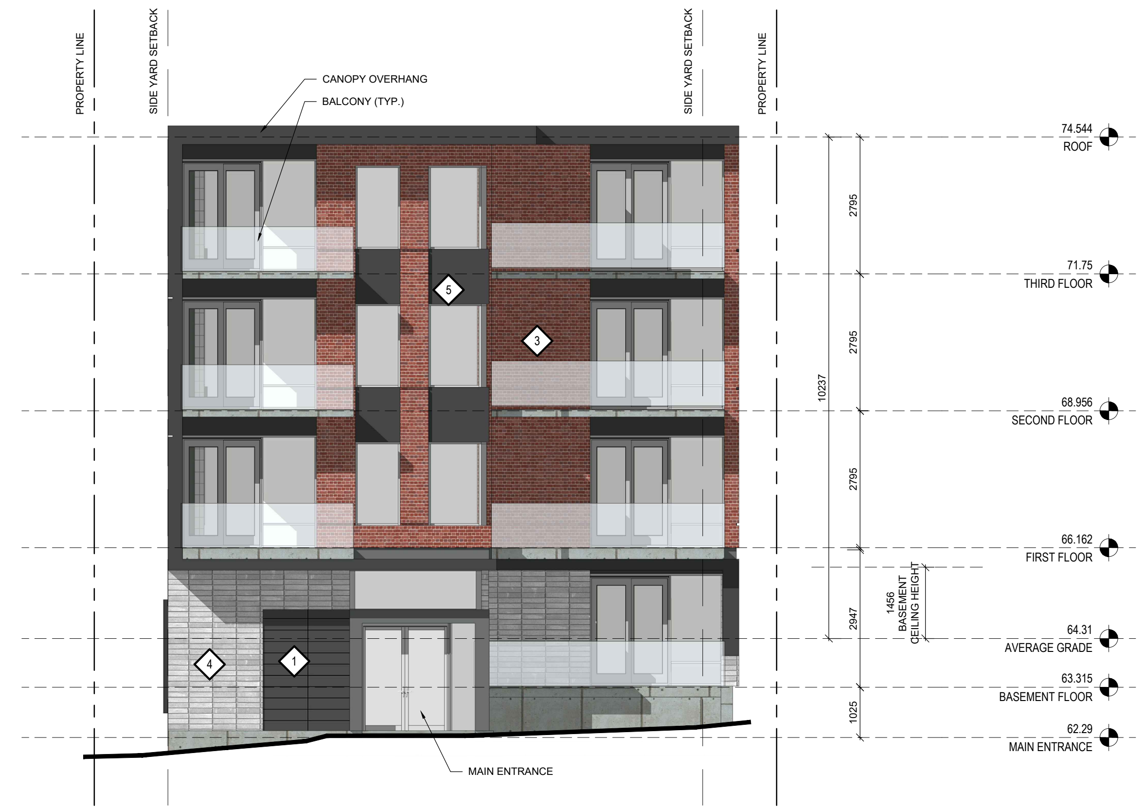
1 EAST ELEVATION A-200 1:75