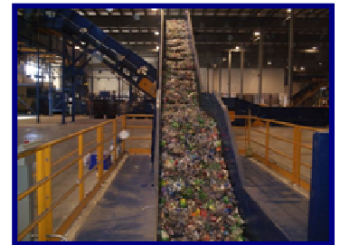
Les matières plastiques retirées du flux de déchets seront recyclées et réutilisées.

visions, les taux de réacheminement visés par notre installation se situeront entre 43 et 57 %.