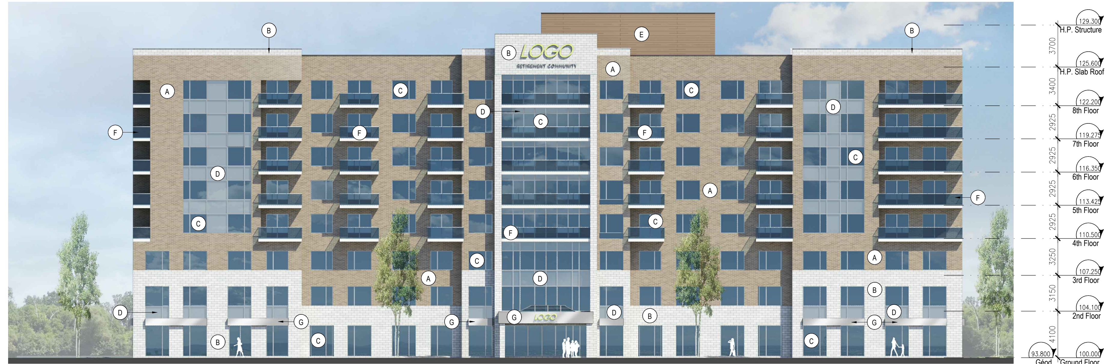
NORTH ELEVATION 1 1:200 A400