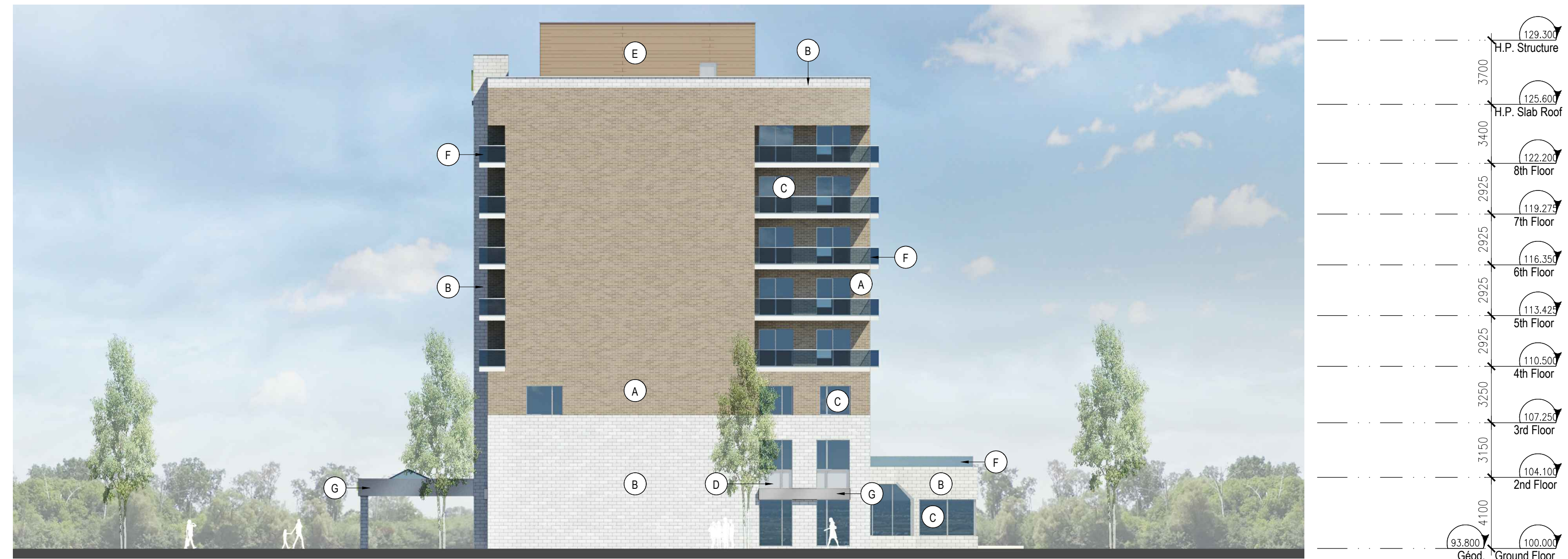
WEST ELEVATION 2 1:200 A400